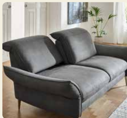
Einzel verstellbare Kopfpolster mit Rasterfunktion