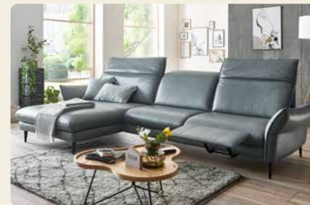
Longchairkombination mit Kopfpolster-/ Armteilverstellung und motorischer Beinauflage, Bezug Leder Vivre steel, Stellmaß 180x337 cm