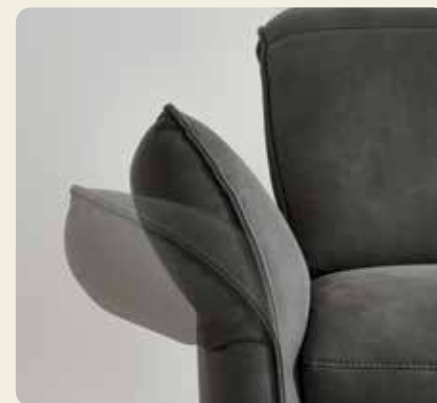
Liegearmlehnen in allen Elementen mit Armlehne möglich; außer im Sessel